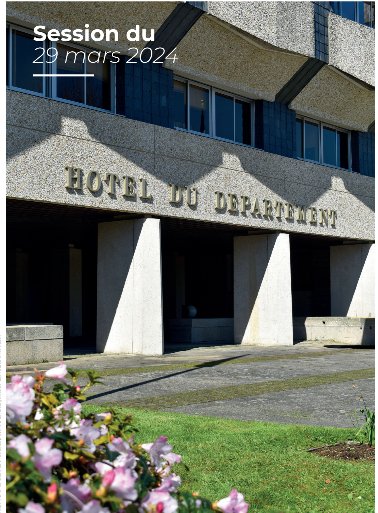
Création-impression: Conseil départemental du Morbihan Papier PEFC fabriqué à partir de pâtes provenant de forêts gérées de façon durable. Mars 2024.